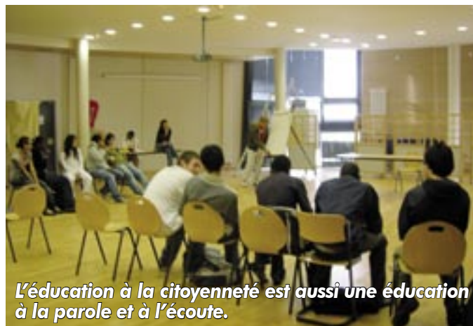
L'éducation à la citoyenneté est aussi une éducation à la parole et à l'écoute.