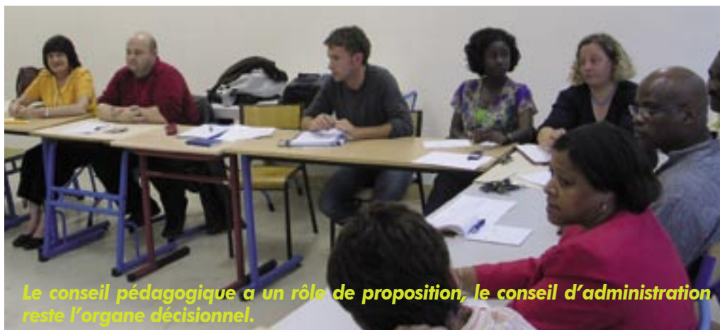
Le conseil pédagogique a un rôle de proposition, le conseil d'administration reste l'organe décisionnel.

de rester très sensible et s'il cristallise les différences de représentation sur le métier d'enseignant. Ce sujet pose aussi des questions fondamentales : comment aider les élèves à apprendre, par quels moyens et comment évaluer leurs apprentissages ? Le système éducatif reste beaucoup trop ancré dans la démarche sanction récompense construite sur la notation chiffrée. Le conseil pédagogique peut permettre aux élèves, aux parents comme aux enseignants de