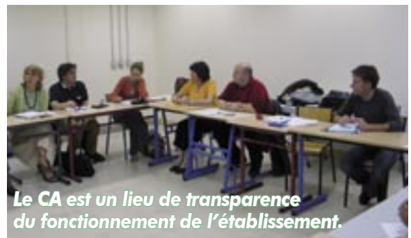
Le CA est un lieu de transparence du fonctionnement de l'établissement.

Quel en est l'enjeu ? Tout d'abord le chef d'établissement doit faire voter ce qu'on lui demande (dotation horaire, compte financier, conventions, contrats) et pour les autres partenaires, c'est un vote de confiance pour ne pas bloquer le fonc-