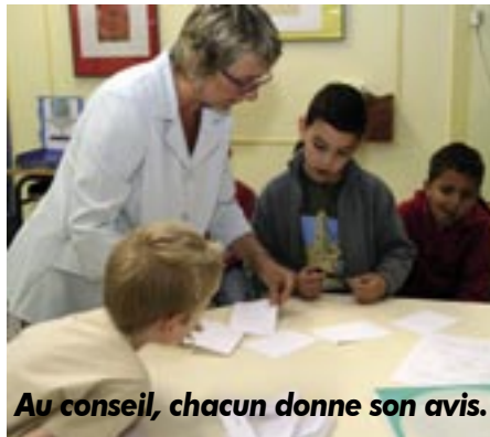
Au conseil, chacun donne son avis.

À la suite du premier conseil d'élèves, les délégués de cycle 3 ont été invités au conseil d'école. Lors du premier, ils étaient très fiers de leur participation même s'ils se sont un peu ennuyés devant la longueur de la séance. Leur présence a cependant déclenché un malaise de la part des adultes – parents et enseignants – qui ne s'exprimaient plus comme ils le faisaient avant. Lors du deuxième conseil d'école, les délégués ne